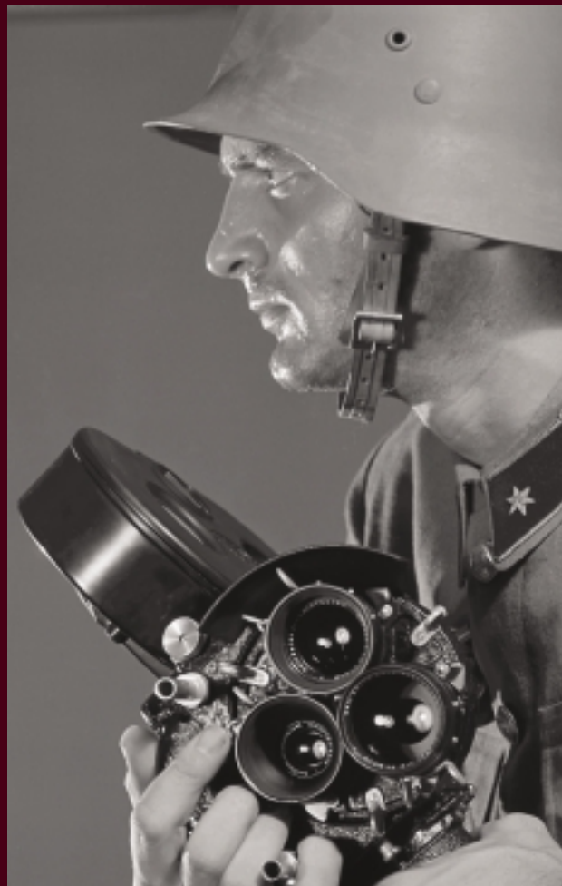
Németh József: Haditudósító, 1940-es évek