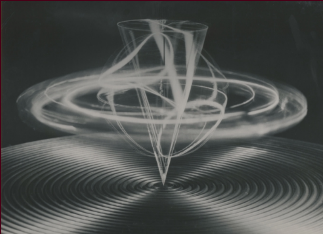
Bárány Nándor: Forgástestek, 1930-as évek