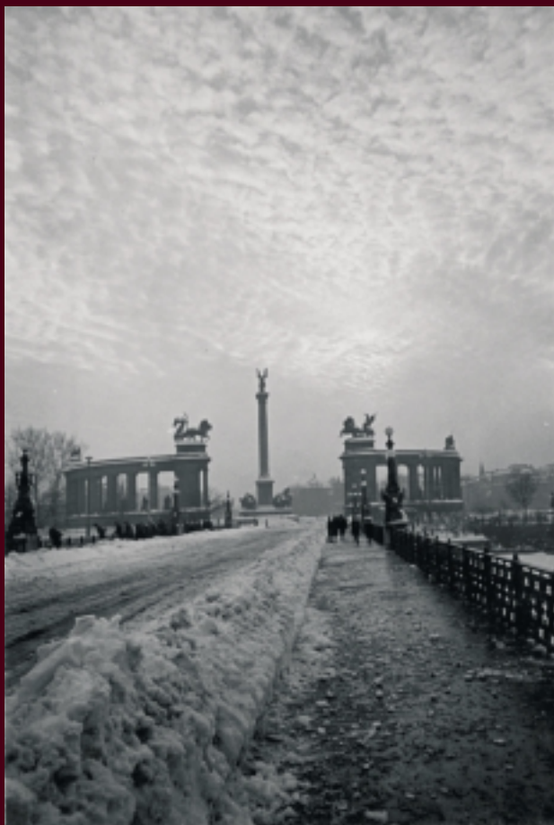
Dulovits Jenő: Hősök tere, 1930-as évek