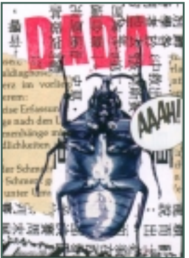
Artists Trading Card 63 x 88 mm méretű művészkártyák a baseball- és kosárlabdakártyák mintájára. Cserék, kollektív csomagok és vándorkiállítások tárgya.