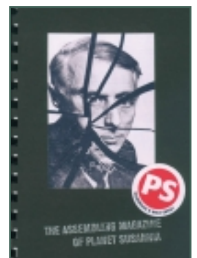
▲ Assembling Magazine „22” 22 művész eredeti, számozott és szignált lapjaiból készült unikát kiadvány. Az alkotók eredeti példányt kapnak a kötetből.